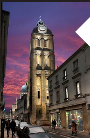
Tour de l'horloge